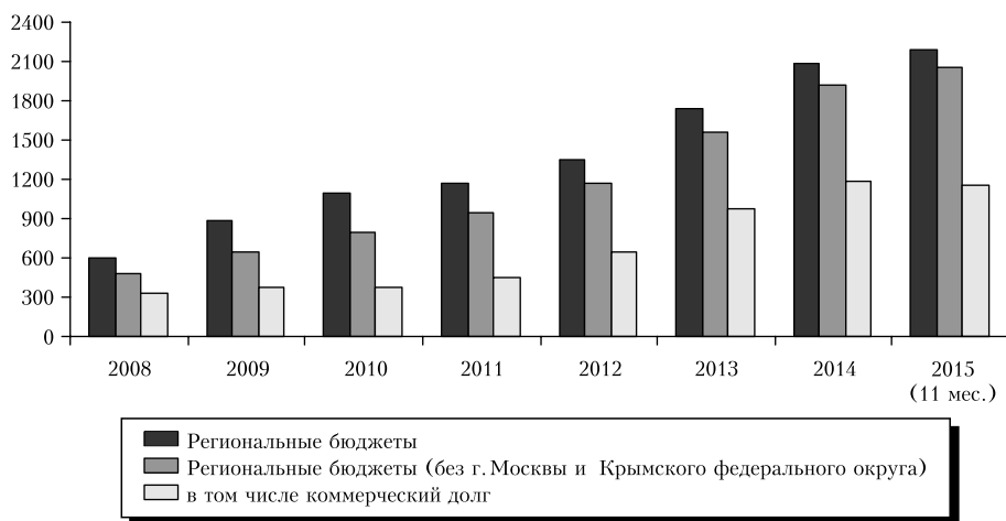
Задолженность бюджетов субъектов РФ (млрд руб.)

Важным трендом стало замедление роста долга консолидированных региональных бюджетов по сравнению с 2013 и 2014 гг. — рост составил порядка 5% (за 11 месяцев) 12 . В 2015 г. коммерческий долг замещался долгом перед Министерством финансов, причем при росте