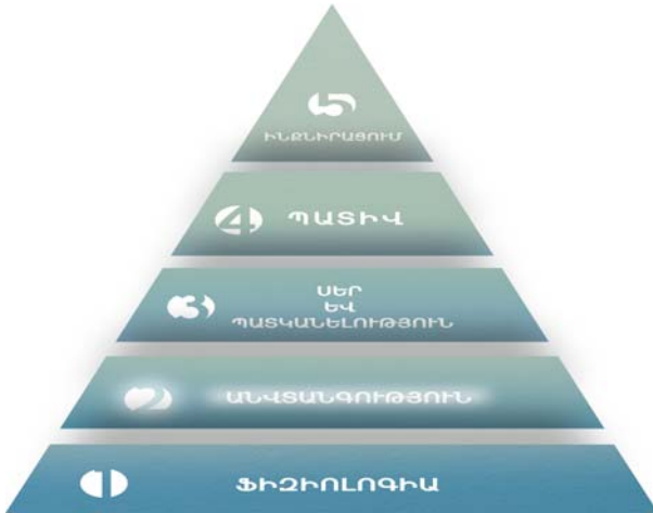
Գծանկար 1. Մասլոուի պահանջմունքների բուրգը

վտանգության նկատմամբ պահանջմունքը արտացոլված է տնտեսագետներին քաջ հայտնի ամերիկացի հայտնի հոգեբան, հումանիտար հոգեբանության հիմնադիր Ա. Մասլոուի (Abraham Maslow) պահանջմունքների բուրգում (տե՛ս Գծանկար 1) և համարվում է մարդու հիմնարար պահանջմունքներից մեկը՝ տեղ գտնելով ֆիզիոլոգիական պահանջմունքներից անմիջապես հետո: